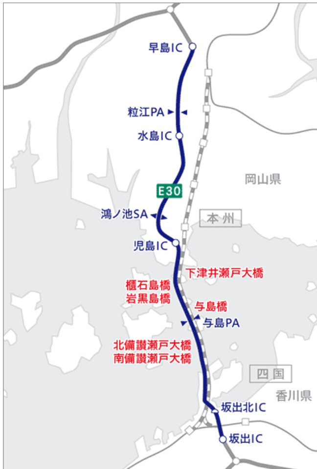
E30 瀬戸大橋自動車道（瀬戸大橋）| 本四高速

( www.jb-honshi.co.jp/customer_index/guide/route-guide/use_d.html )より引用