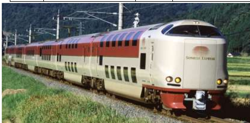
↑サンライズ瀬戸・出雲 サンライズ瀬戸・出雲・JR おでかけネット

( www.jr-odekake.net/train/sunriseseito_izumo/ )より引用